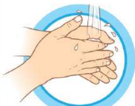
ЧАСТО МОЙТЕ РУКИ С МЫЛОМ