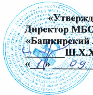
График питания обучающихся